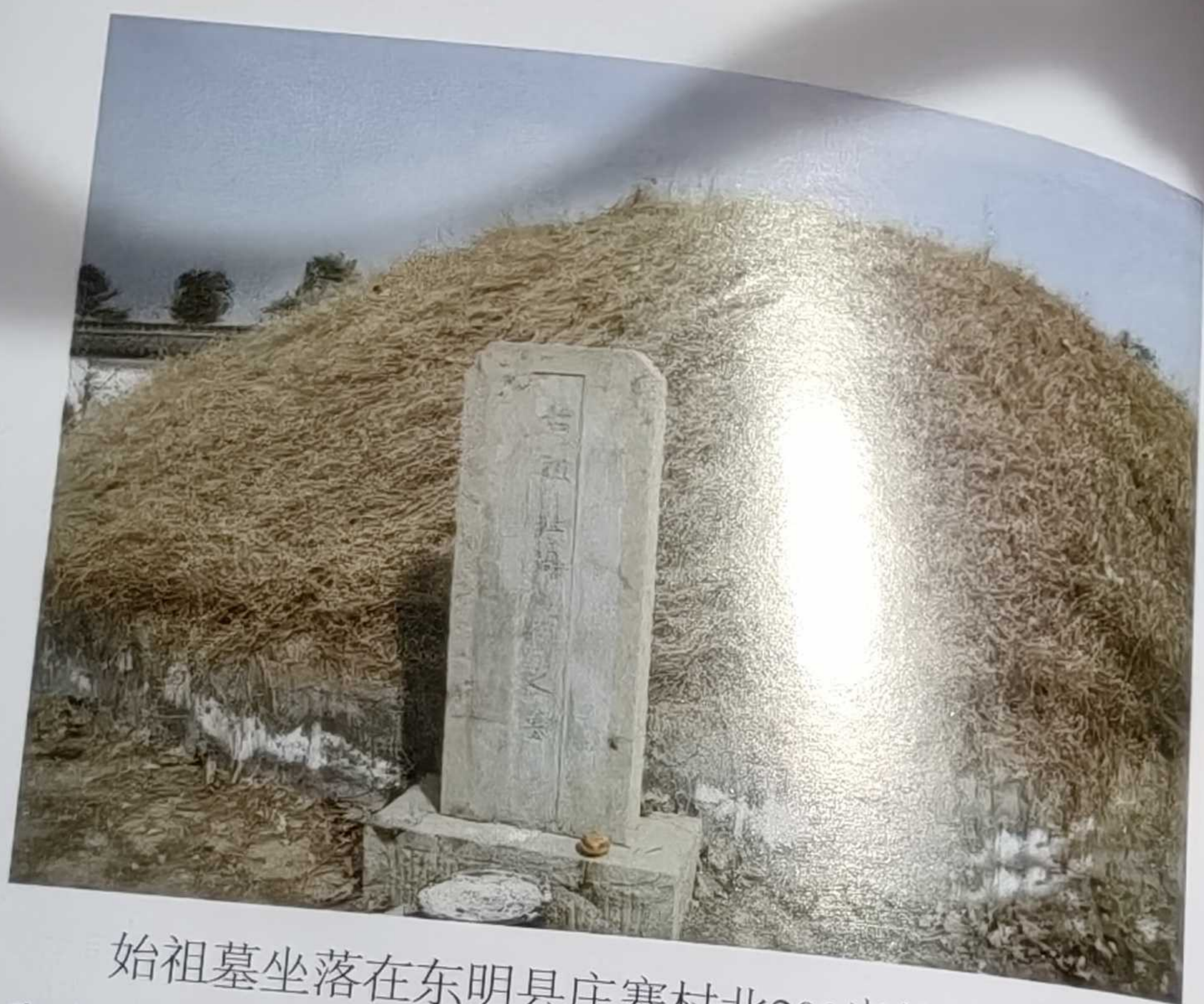
始祖墓坐落在东明县庄寨村北200米处的龙山文化和商周文化遗址上