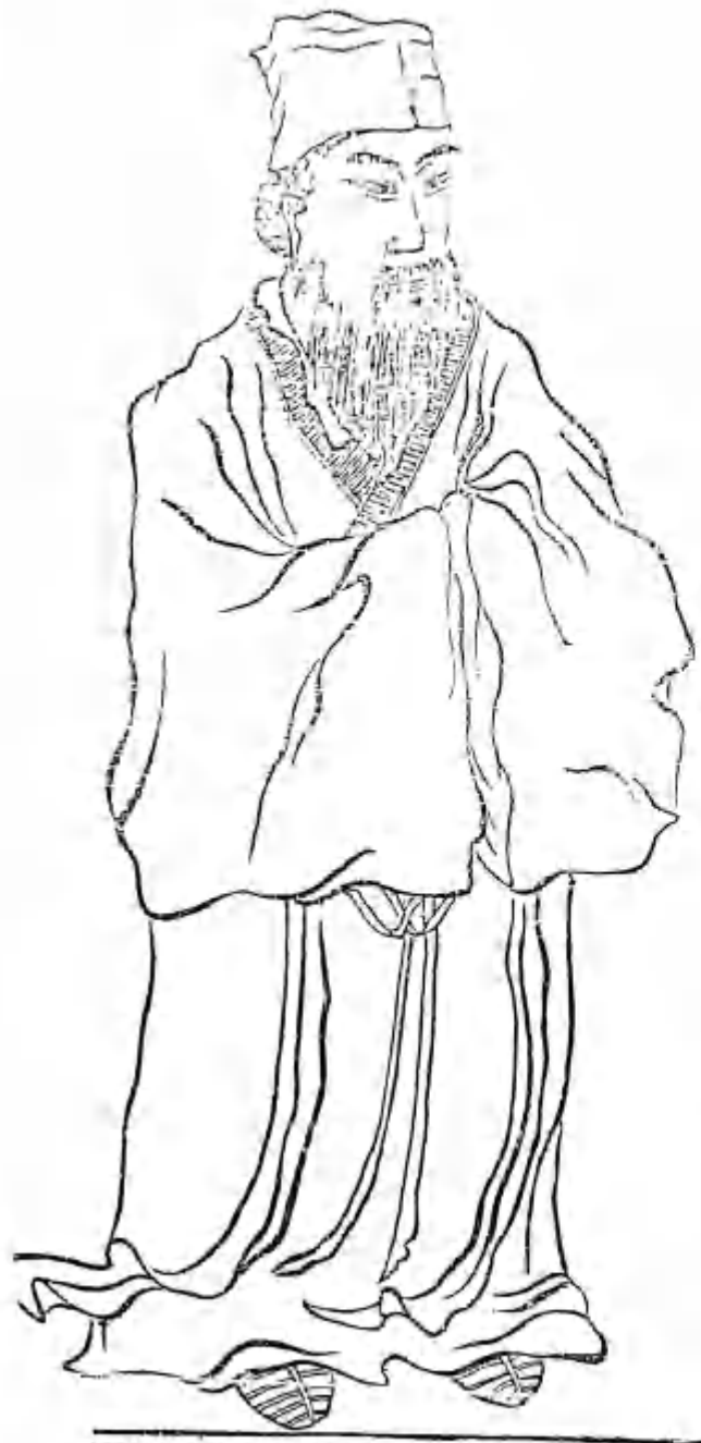
閔子鴻都門學畫像 字子真 魯人 少孔子十五歲