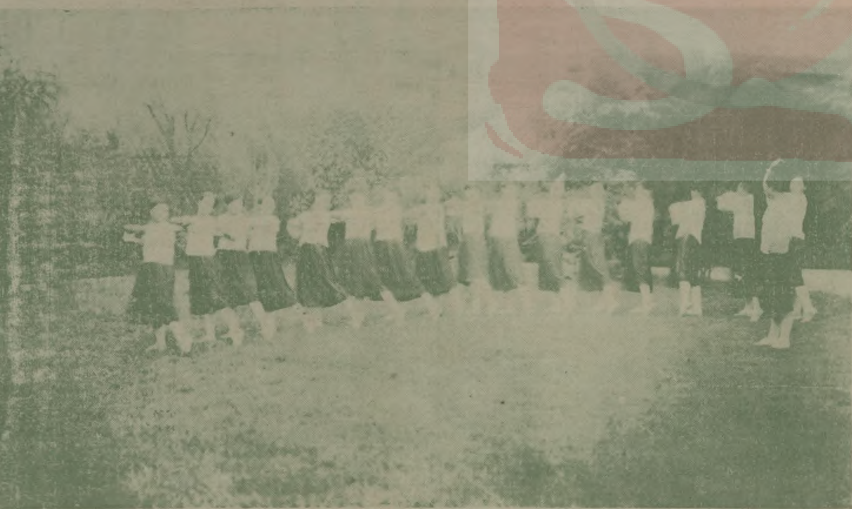
中國女子體育專門學校本屆畢業生之舞(耘殮贈)

蔣總司令昨日發表重要談話。稿由戊辰通訊社代發。先時由某君發函通知各報。於是各報皆預備一特別地位以待之。此談話稿第一句。為「昨日有新聞界某君往訪蔣總司令。詢問蔣氏對於黨國時局之意見。讀者皆不知此所謂新聞界之某君係指何人。乃有如許大腕力。以上海各報之外勤記者。只會猴來猴去。搗些小貨。未必能探出此種重要訪稿來也。後乃知某君即係陳布雷君。並有人謂此篇談話。通篇皆出自陳君手筆。惟經蔣總司令審閱無誤後始發表耳。 曼殊上人。姓蘇名子殺。又名玄瑛。廣東中山。(即香山)其澳村人也。其文章固纏綿悱惻。其詩歌復哀豔悲涼。通數國語言文字。尤邃於我佛至理。在民國七年逝於上海廣慈醫院。得汪精衛先生理其身後事。及後。友人攜其遺骸葬於西湖孤山之陰。與恬淡之和靖。薄命之小青。共分此湖山。無情黃土。有恨青山。埋藏此畸零之高僧。流落之詩人。曠代奇士。至今展拜墓前。猶不勝其飄零淪落之感也。