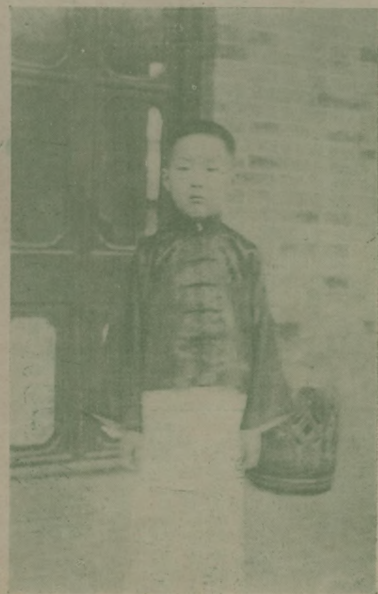
孔子之七十七代裔即所謂衍聖公者

蔣總司令昨日發表重要談話。稿由戊辰通訊社代發。先時由某君發函通知各報。於是各報皆預備一特別地位以待之。此談話稿第一句。為「昨日有新聞界某君往訪蔣總司令。詢問蔣氏對於黨國時局之意見。讀者皆不知此所謂新聞界之某君係指何人。乃有如許大腕力。以上海各報之外勤記者。只會猴來猴去。搗些小貨。未必能探出此種重要訪稿來也。後乃知某君即係陳布雷君。並有人謂此篇談話。通篇皆出自陳君手筆。惟經蔣總司令審閱無誤後始發表耳。 曼殊上人。姓蘇名子殺。又名玄瑛。廣東中山。(即香山)其澳村人也。其文章固纏綿悱惻。其詩歌復哀豔悲涼。通數國語言文字。尤邃於我佛至理。在民國七年逝於上海廣慈醫院。得汪精衛先生理其身後事。及後。友人攜其遺骸葬於西湖孤山之陰。與恬淡之和靖。薄命之小青。共分此湖山。無情黃土。有恨青山。埋藏此畸零之高僧。流落之詩人。曠代奇士。至今展拜墓前。猶不勝其飄零淪落之感也。